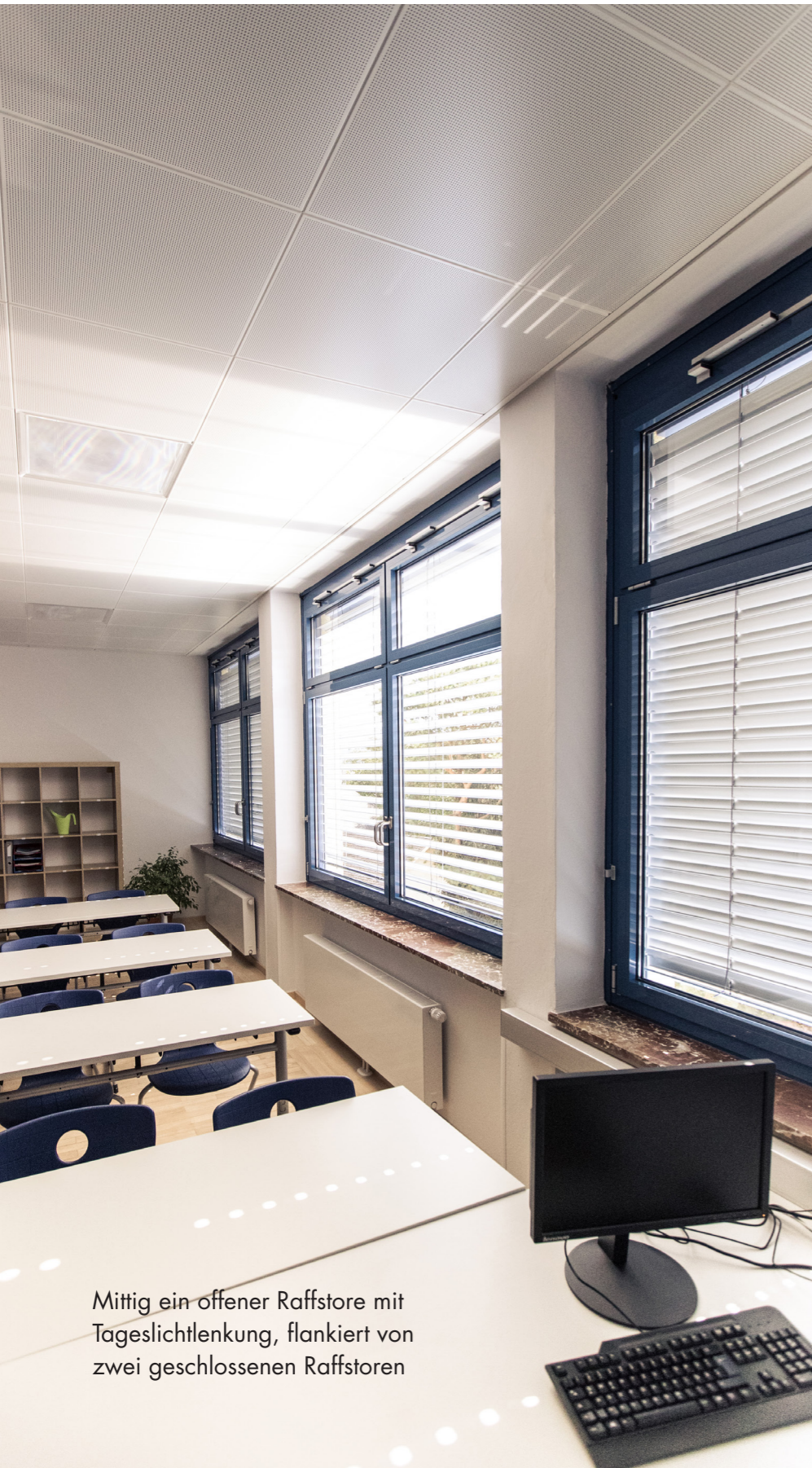
Mittig ein offener Raffstore mit Tageslichtlenkung, flankiert von zwei geschlossenen Raffstoren

Licht beeinflusst den Tag-Nacht-Rhythmus und damit das Leben von Mensch und Tier. Unser innerer Taktgeber, der Nucleus suprachiasmaticus im Hypothalamus, kontrolliert die zirkadianen Rhythmen (24-Stunden-Rhythmen) wie den Schlaf-Wach-Wechsel und verschiedene Stoffwechselreaktionen.